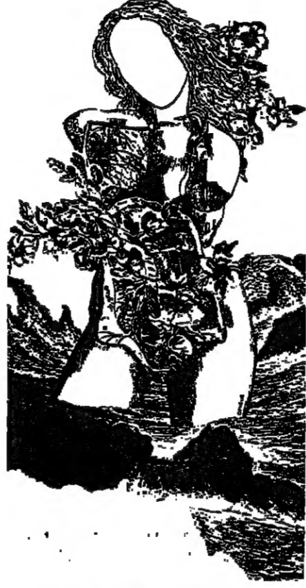
المرأة عند فيان، غلبة اسطورية